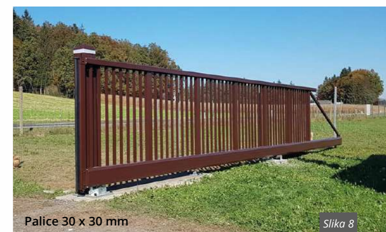
Palice 30 x 30 mm