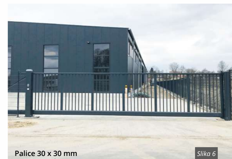
Palice 30 x 30 mm