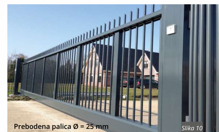
Prebodena palica Ø = 25 mm