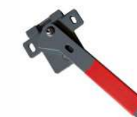
Držalo za vrata