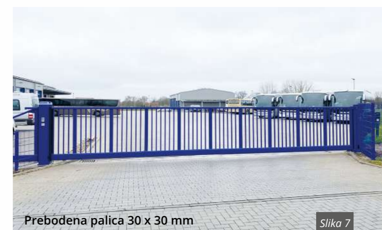
Prebodena palica 30 x 30 mm