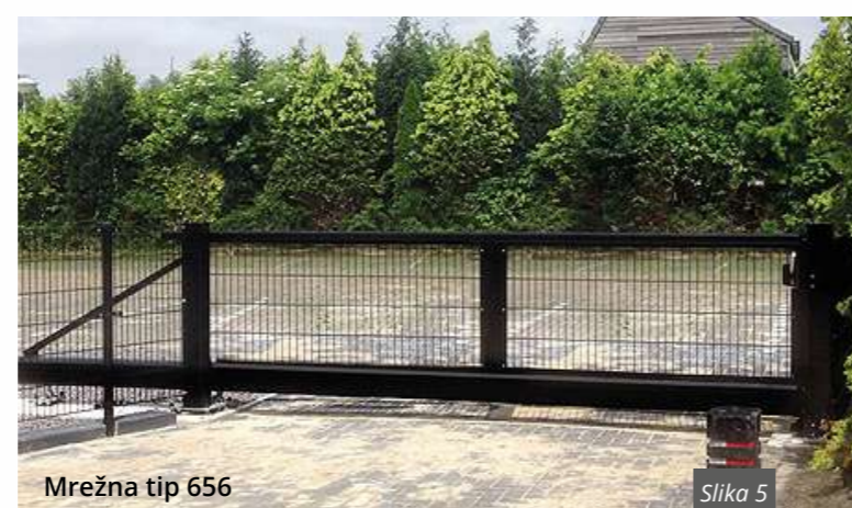
Mrežna tip 656