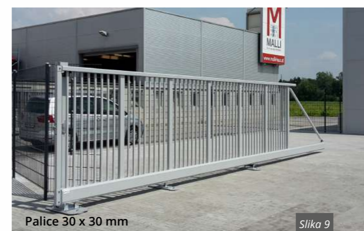
Palice 30 x 30 mm