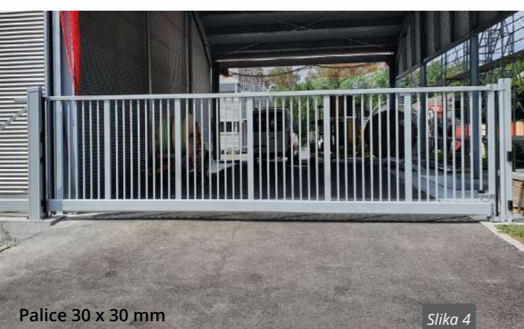
Palice 30 x 30 mm