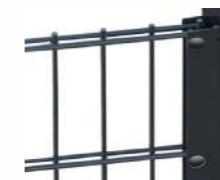
Priključek za ograjo